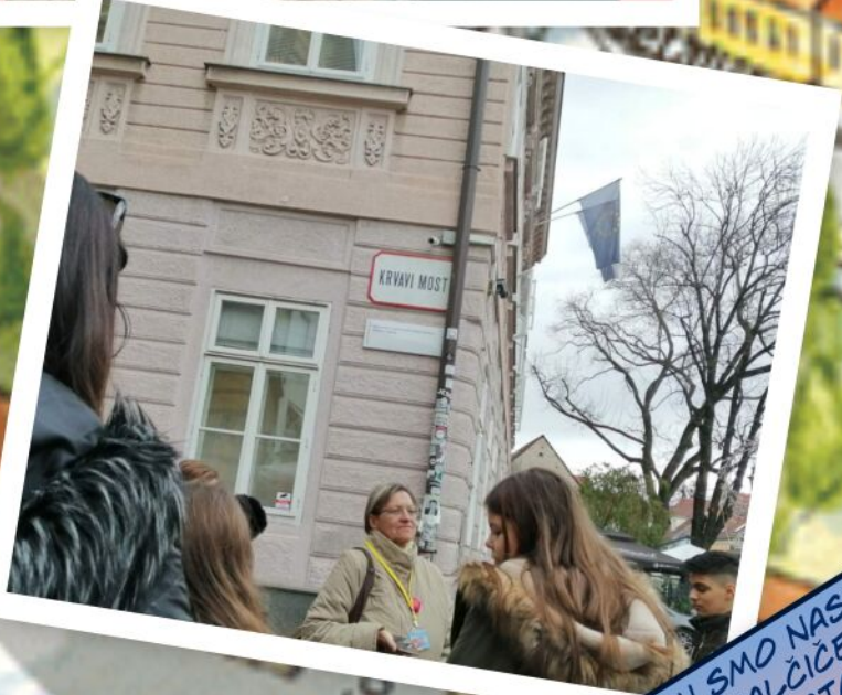
ŠETNJU SMO NASTAVILI ULICAMA KRVAVI MOST I TKALČICEVOM, PROŠLI SMO KROZ KAMENITA VRATA I DOŠLI NA MARKOV TRG.