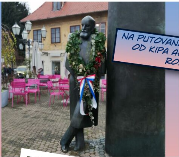
NA PUTOVANJE KROZ VRIJEME KRENULI SMO OD KIPA AUGUSTA ŠENOEA, U NJEGOVOJ RODNOJ VLAŠKOJ ULICI.